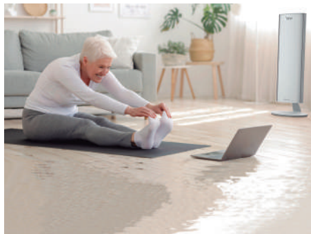
Residências Particulares Private Residences