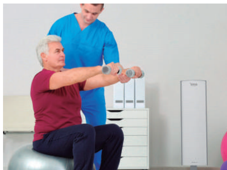
Clínicas e Hospitais Clinics & Hospitals