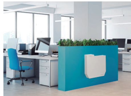
Escritórios e Serviços Offices & Services