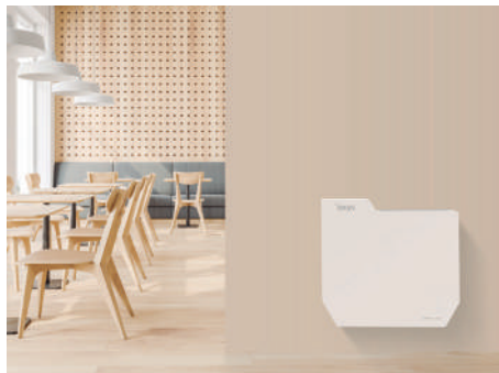
Restaurantes e Hotéis Restaurants & Hotels

The versatility of the OXYS® Clean Air models allows them to be used in the most varied spaces, offering superior performance in eliminating any bacterial and viral load.